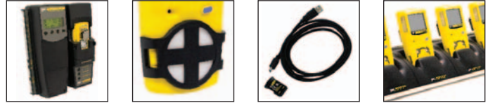
MicroDock II 兼容 辅助过滤器 套件 红外连接套件 5 组托架充电器